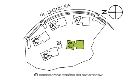
Ⓜ pomieszczenie wspólne dla mieszkańców

1. Przedstawione w tym materiale elementy wyposażenia mają jedynie charakter poglądowy, stanowią propozycję aranżacji i nie są objęte ofertą sprzedaży lokalu mieszkalnego/usługowego przedstawioną przez Yawa Sp. z o.o. 7 Sp. k.